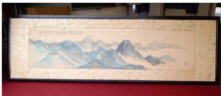
北アルプス連峰 (267 cm×60 cm)

区や村とのかかわり 文人肌で詩画三昧の生活を望んでいた香雨ですが、生まれ育った七日市場や村との関わりも多くありました。